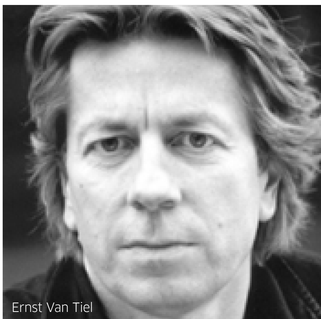
Ernst Van Tiel

Anna Kociarz aktorka Ernst Van Tiel dyrygent Orkiestra Symfoniczna Polskiej Filharmonii Bałtyckiej PROKOFIEV Symfonia klasyczna op. 25 nr 1 RAVEL Dafnis i Chloe Suita nr 2 RIMSKI-KORSAKOW Suita symfoniczna Szeherazada op. 35